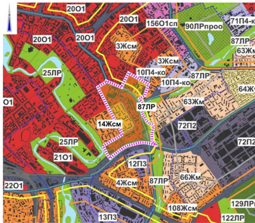
СХЕМА РАЗМЕЩЕНИЯ ПДП В ПЛАНИРОВОЧНОЙ СТРУКТУРЕ ГОРОДА