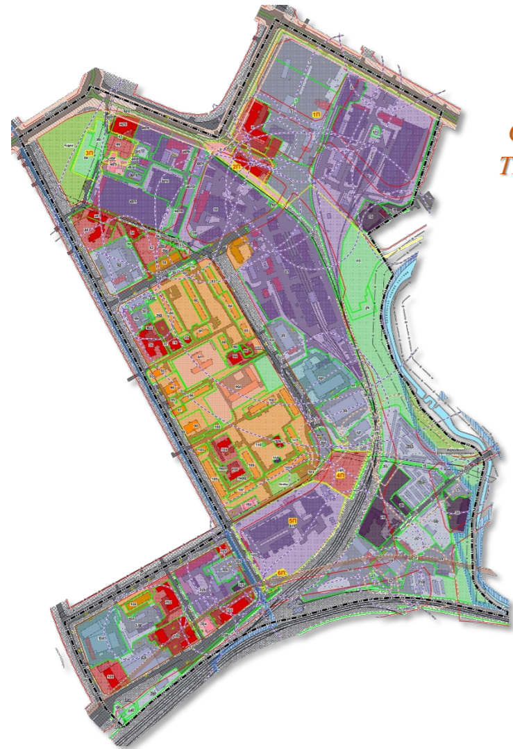
СХЕМА РАЗМЕЩЕНИЯ ПРОЕКТИРУЕМОЙ ТЕРРИТОРИИ НА ДЕТАЛЬНОМ ПЛАНЕ